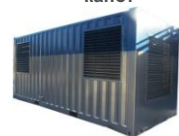
Антивандаальный контейнер Север-М