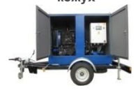
Мобильный вариант (на прицепе, на лыжах - полозьях)