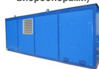
Утеплённый блок - контейнер Север (БКЭ)