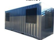
Антивандаальный контейнер Север-М