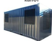
Антивандаальный контейнер Север-М