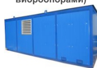
Утеплённый блок - контейнер Север (БКЭ)