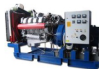
Открытый вариант (на раме с виброопорами)

Для удобства эксплуатации дизельных электростанций ООО "Генератор тока" предлагает различные варианты исполнения, что позволит использовать их мощности на 100% в любых условиях. Утеплённый блок-контейнер позволит генератору стабильно работать в самых суровых погодных условиях и при самых низких температурах, погодозащитный кожух поможет защитить станцию от осадков и грязи, а шасси и полозья будут незаменимы, если электростанция должна быть мобильна.