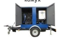
Мобильный вариант (на прицепе, на лыжах -полозьях)