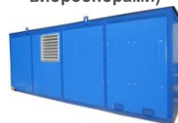
Утеплённый блок - контейнер Север (БКЭ)