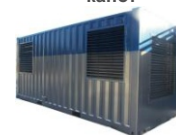
Антивандаальный контейнер Север-М