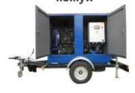
Мобильный вариант (на прицепе, на лыжах -полозьях)