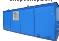
Утеплённый блок - контейнер Север (БКЗ)