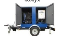
Мобильный вариант (на прицепе, на лыжах -полозьях)